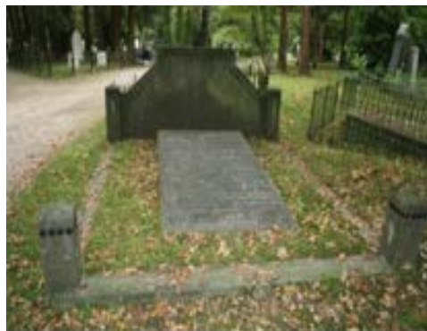
Graf Roeterdink 1 e Klas 304

Een groep vrijwilligers ontroest hekwerken, waarna ze deze van een nieuwe zwarte verflaag voorzien en de punten met zilverkleur afwerken.