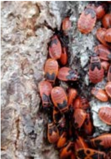
Vuurwantsen kom je tegen op een muur of boomstam.

Tijdens het schoonmaken verwonderen zij zich over de flora en fauna zoals een aparte slak of vuurwantsen, maar ook een roodborstje en de eekhoorn.